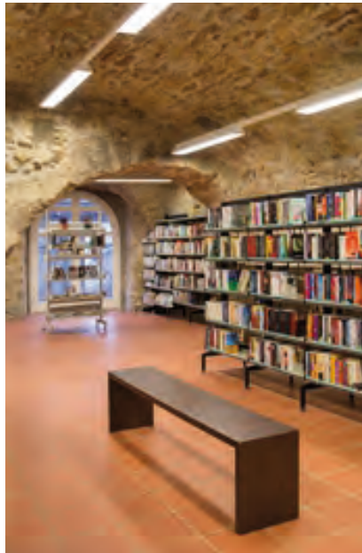
Regionalbibliothek Klingnau © 2016 Klingnau